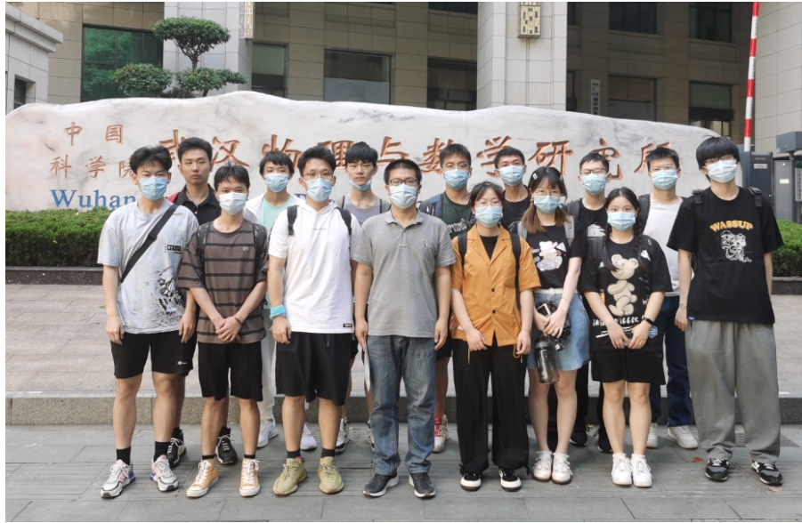
同学们在中科院完成实习留念