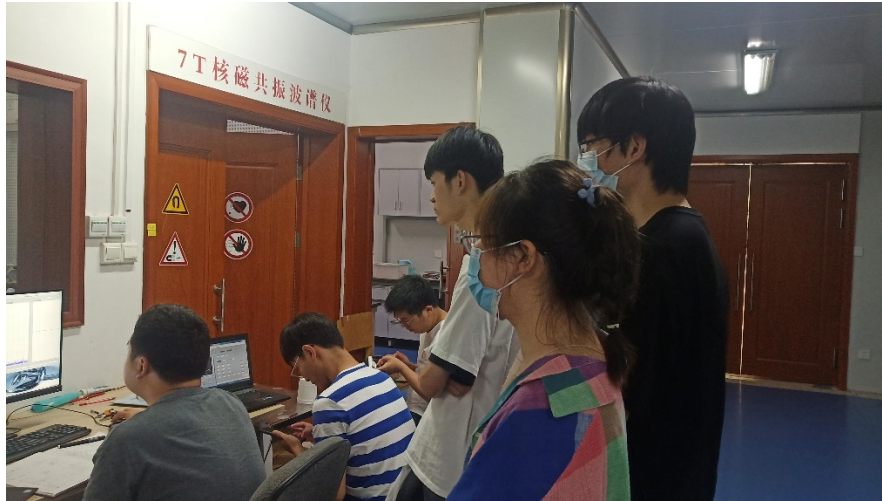
学生参观学习 7T 核磁共振波谱仪实验