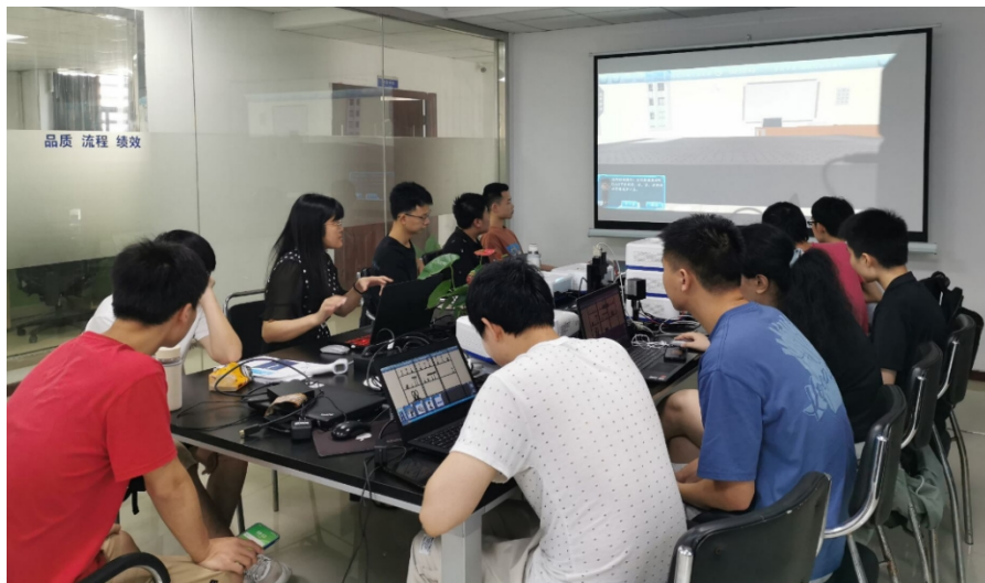
学生学习使用、调试虚拟实验平台